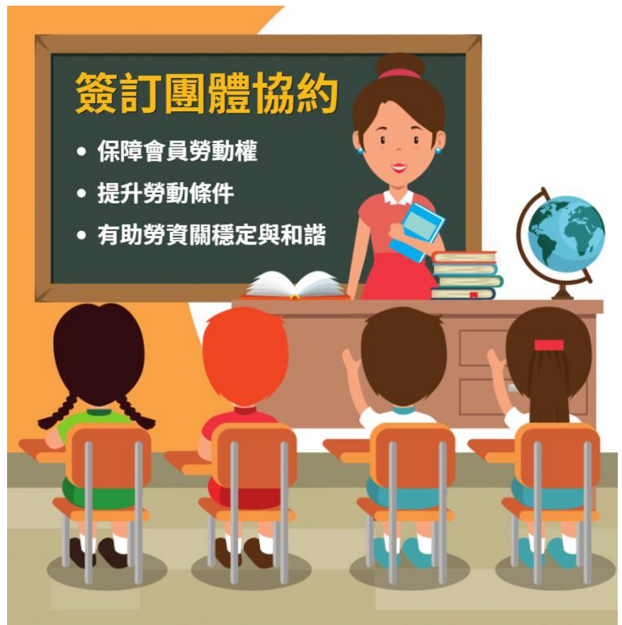
TYU 桃園市各級學校產業工會

本學期期初本市國中小校長線上會議中邀請到勞動局宣導，依據《桃園市 111 年獎勵工會及事業單位簽訂團體協約實施計畫》，產/職業工會與事業單位(雇主團體或機關學校等)簽訂團體協約，工會及學校各別可得獎勵 1 萬元整！受理申請期間自 111 年 3 月 1 日至 111 年 11 月 30 日止。歡迎各校踴躍與本會簽定團體協約！