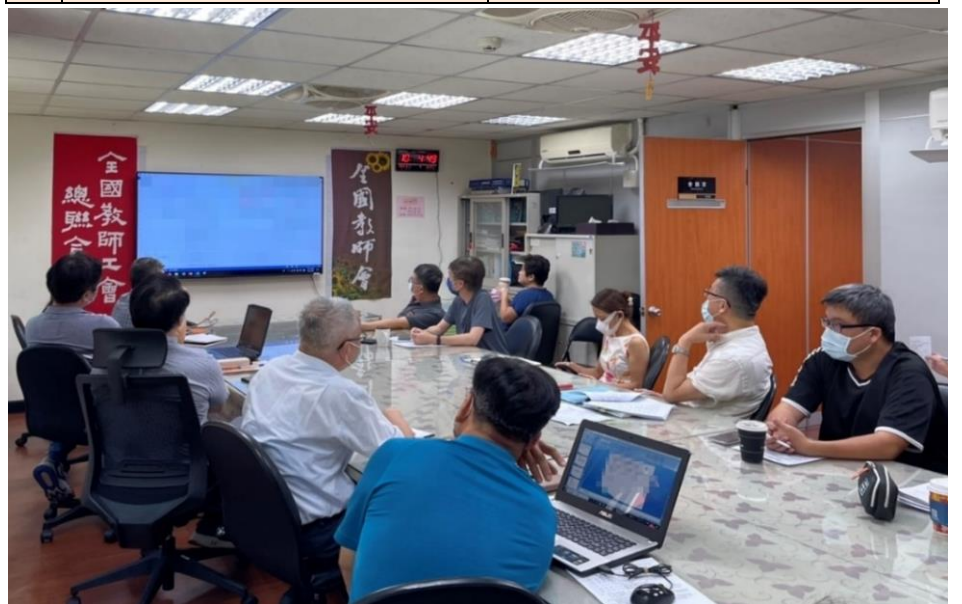
【圖片說明：立院即將開議，全教總的幹部們盤點相關法案中】